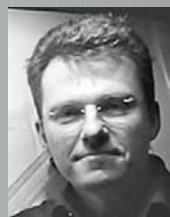
Bühne Andreas Wilkens