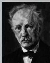
Komposition Richard Strauss