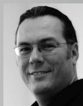
Inszenierung Jochen Biganzoli