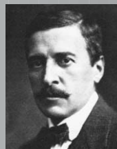
Libretto Hugo von Hofmannsthal